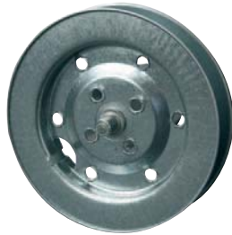
4 Eje Metálico 60 x 0.4 R