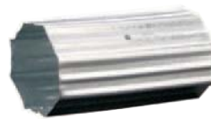
5 Cápsula Metálica 60 R